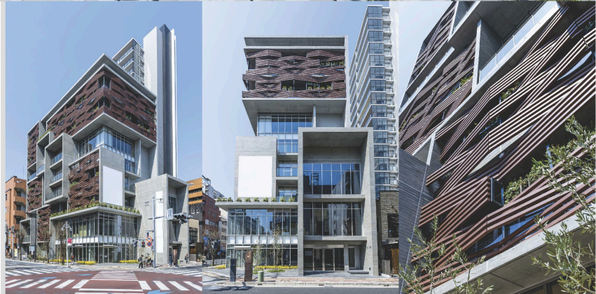
■ 素材の積層で時代の積み重なりを表現

古くは中仙道浦和宿沿いとして、現在は浦和駅前の交差点に建つ商業施設。 街の発展とともに、いつもこの地の風景は街の象徴としてあり続けてきた。 そしてこれからも急速に移り変わる風景の中に昂然とたたずみ、 商業活動の場をつくり、街の賑わいと市民の交流の場を生み出す建物としてあり続け、 街並みのシンボルを新しい形で継承する。